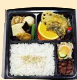
No.4 白飯入り精進 2,500円