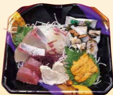
No.15 一人用特上刺身 (お持ち帰り用) 2,900円