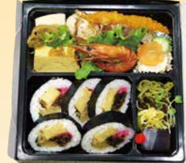
No.25 巻寿司入り 2,700円