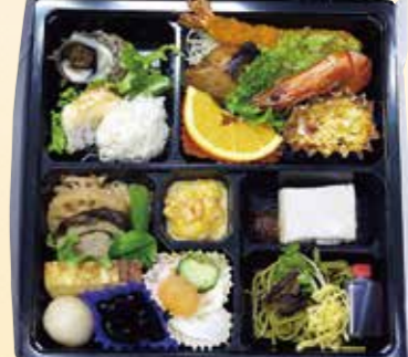
No.28 おかずのみ 4,500円