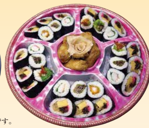
No.42 寿司盛 (44cm皿) 5,800 円