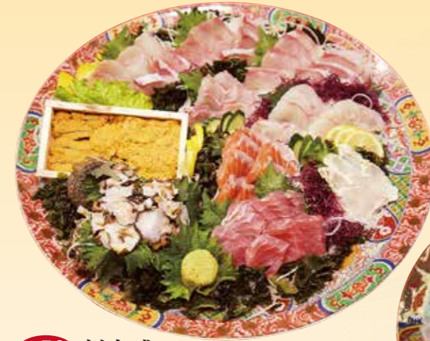
No.50 刺身盛 (46cm皿) 18,000 円