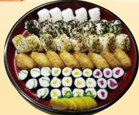
No.2 むすび、稲荷、細巻精進盛 (42cm桶) 6,500円