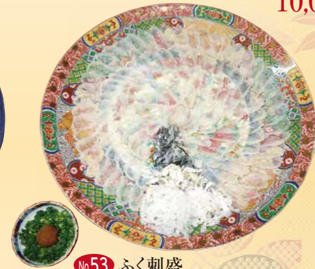
No.53 ふく刺盛 (46cm皿) 20,000 円