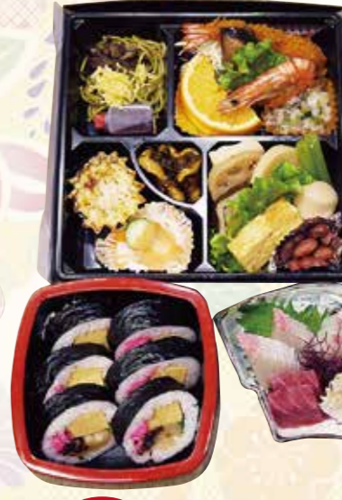
No.34 おかずのみ折詰と刺身、吸物、 茶碗蒸、寿司 7,100円