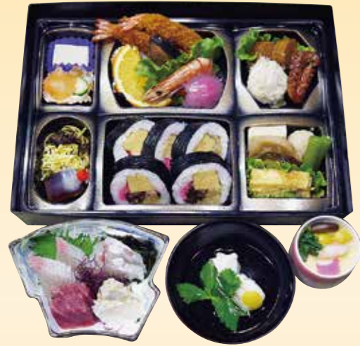
No.36 寿司入り折詰と刺身、吸物、 茶碗蒸 7,500 円

※刺身はすべて保冷箱に入れて配達いたします。 ※ふく刺のご注文は作業工程上2日前までにご注文くださいませ。