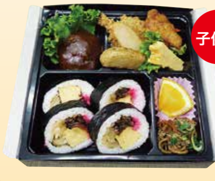
No.22 巻寿司入り又はちらし寿司入り 又はむすび入り子供用 2,400円