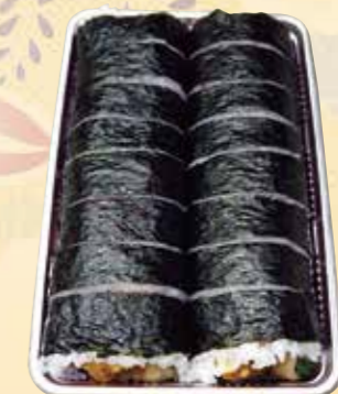
進物として使われます。 3本入りも出来ます。 No.57 巻き寿司2本組 (包装いたします。) 2,000 円