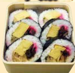
No.7 巻き寿司 (4.5寸折) 830円