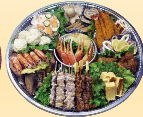
No.46 おかずのみ盛皿 (49cm皿) 16,000 円