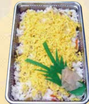
サイズも色々あります。 No.58 ちらし寿司 (包装いたします。) 写真は 1,100 円