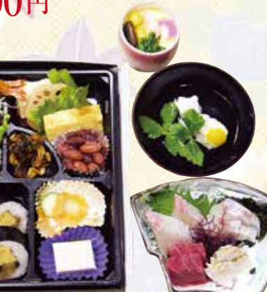
No.32 寿司入り折詰と刺身、吸物、 茶碗蒸 5,600円