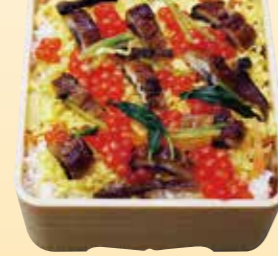
No.10 上ちらし寿司 (4.5寸折) (お持ち帰り用) 2,400円