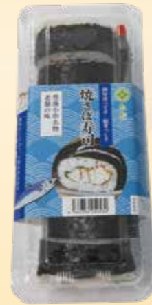
No.55 焼そば寿司 1,300 円