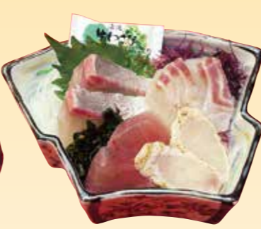
No.12 一人用刺身(器) 1,000円