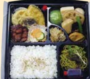
No.5 白飯入り精進 2,900円