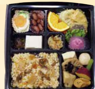
No.6 炊き込み ご飯入り精進 3,400円