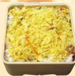
No.8 ちらし寿司 (4.5寸折) 830円