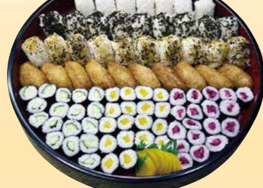
No.3 むすび、稲荷、細巻精進盛 (47cm桶) 9,500円