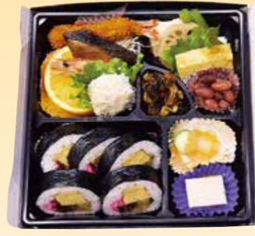
No.30 寿司入り折詰と刺身 4,400円