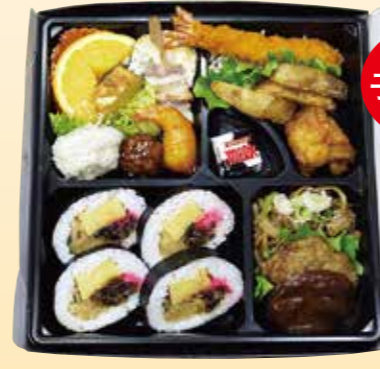
No.23 巻寿司入り又はちらし寿司入り 又はむすび入り子供用 3,000円