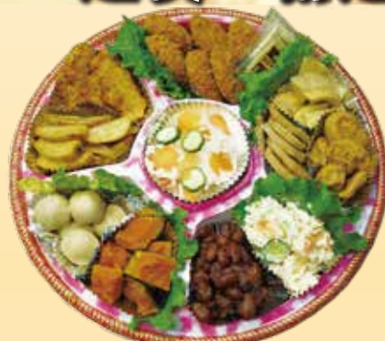
No.1 おかずのみ精進盛皿 (39cm皿) 8,000円