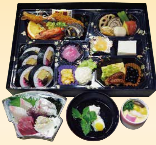
No.37 寿司入り折詰と刺身、吸物、 茶碗蒸 8,200 円