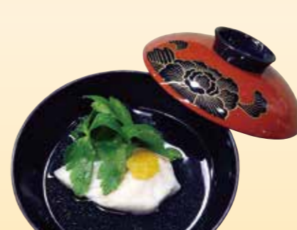
No.17 鯛の吸物 480円