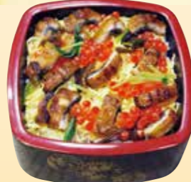
No.9 上ちらし寿司 (4.5寸折) 2,400円