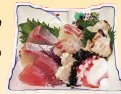
No.13 一人用上刺身(器) 1,700円