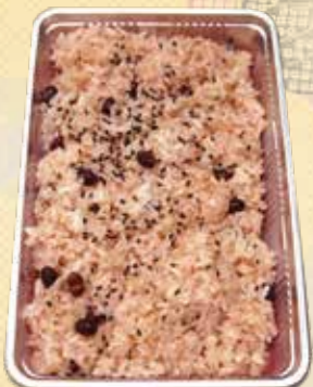
サイズも色々あります。 No.59 赤飯 (包装いたします。) 写真は 1,200 円 (5合) 2,800 円 (1升) 5,600 円