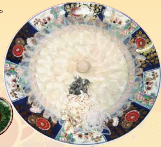
No.52 ふく刺盛 (39.5cm皿) 16,000 円