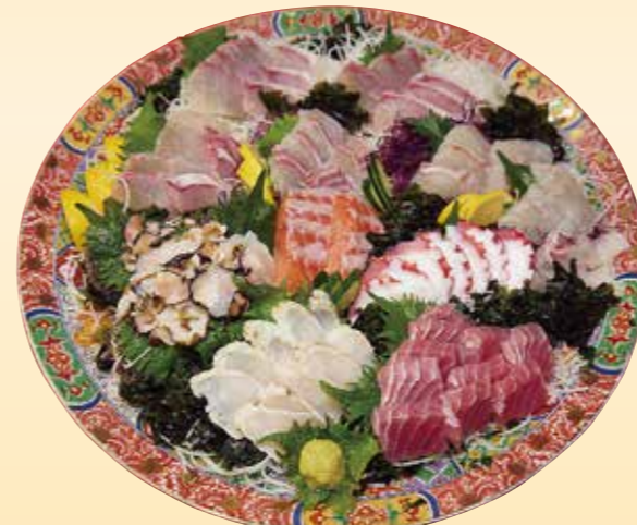
No.49 刺身盛 (46cm皿) 12,000 円