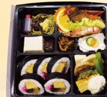
No.31 寿司入り折詰と刺身 5,500円