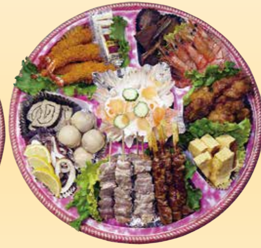
No.45 おかずのみ盛皿 (44cm皿) 12,000 円