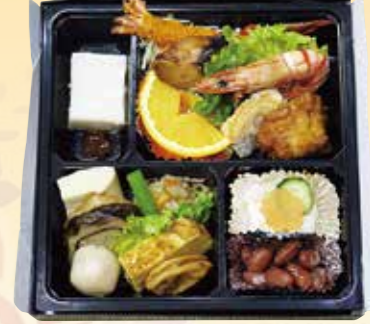
No.26 おかずのみ 2,800円