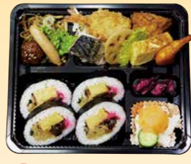
No.20 巻寿司入り又は ちらし寿司入り 1,300円