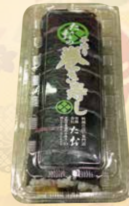
たお一番人気商品です。 No.56 巻き寿司 1,000 円