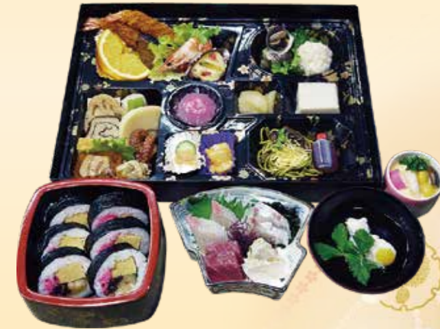
No.40 おかずのみ折詰と刺身、吸物、 茶碗蒸、寿司 9,600 円