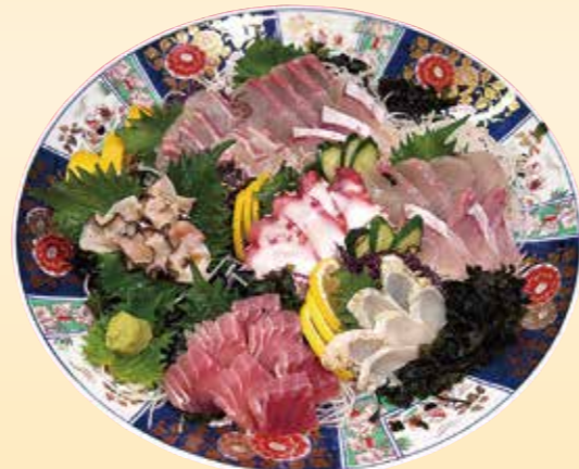
No.48 刺身盛 (39.5cm皿) 7,500 円