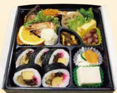
No.27 寿司入り 3,400円