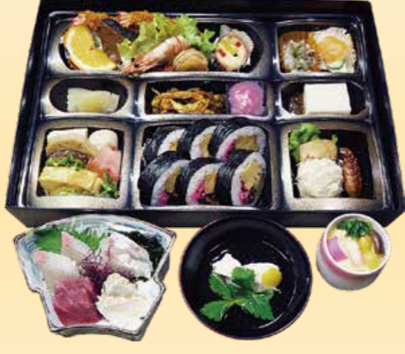
No.39 寿司入り折詰と刺身、吸物、 茶碗蒸 9,500 円