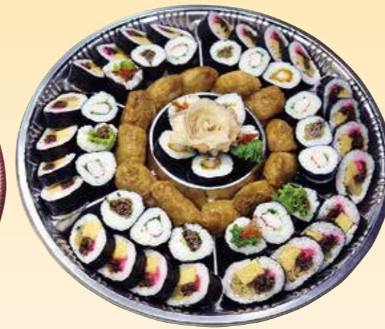
No.43 寿司盛 (49cm皿) 9,300 円