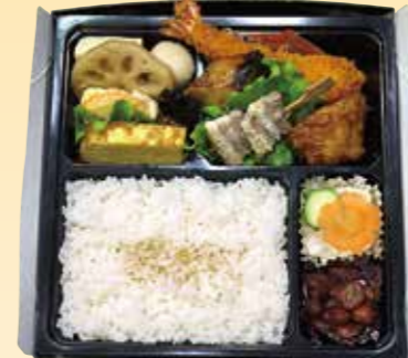
No.24 白飯入り 2,400円