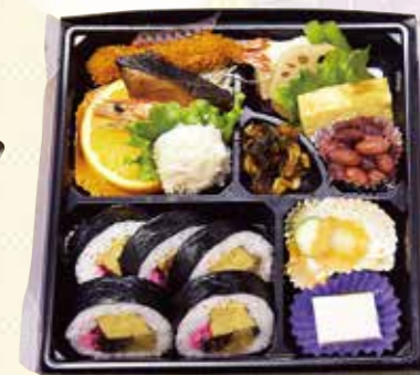
No.32 寿司入り折詰と刺身、吸物、 茶碗蒸 5,600円