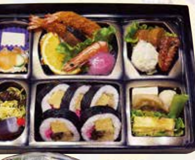
No.35 寿司入り折詰と刺身 6,300円