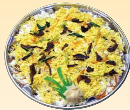
No.41 ちらし寿司 (5合桶) 2,500 円 (1升桶) 4,900 円