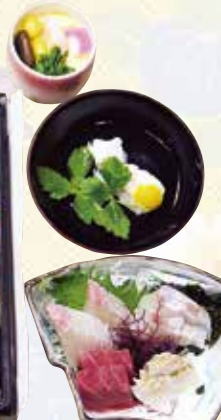
No.32 寿司入り折詰と刺身、吸物、 茶碗蒸 5,600円