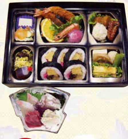
No.35 寿司入り折詰と刺身 6,300円