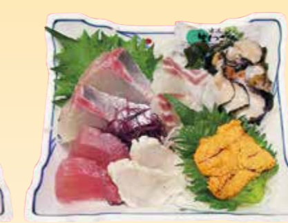
No.14 一人用特上刺身(器) 2,900円