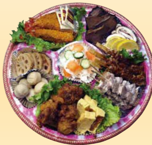
No.44 おかずのみ盛皿 (40cm皿) 7,500 円