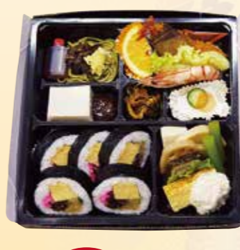
No.33 寿司入り折詰と刺身、吸物、 茶碗蒸 6,700円