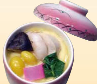
No.16 茶碗蒸 800円