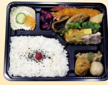
No.21 白飯入り 2,100円