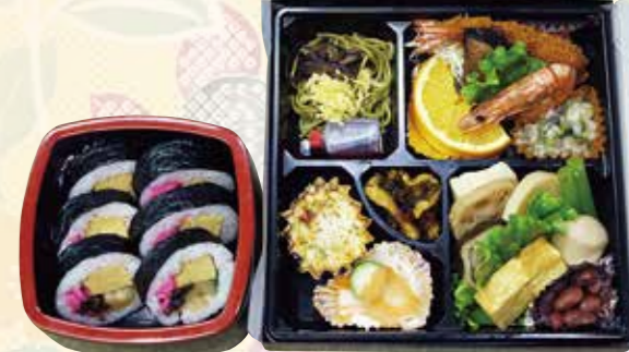
No.29 おかずのみ折詰と寿司 4,900円