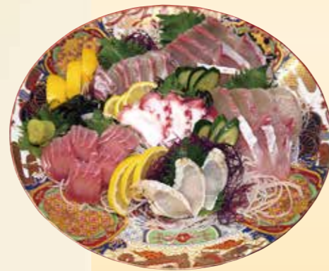
No.47 刺身盛 (33.5cm皿) 5,000 円