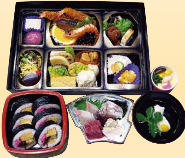
No.38 おかずのみ折詰と刺身、吸物、 茶碗蒸、寿司 8,900 円