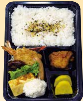
No.18 白飯入り 750円