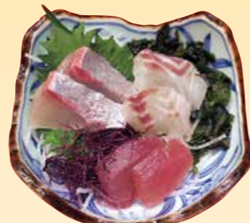
No.11 一人用小刺身(器) 800円