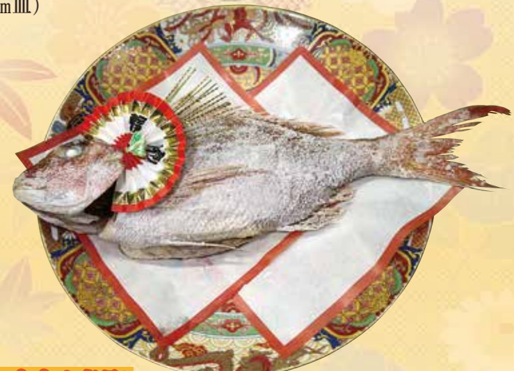
おすすめ商品! No.54 鯛塩焼 (1kg~2kg) 3,000 円~6,000 円