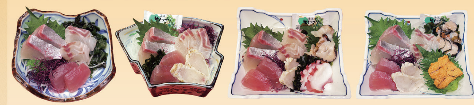
No11 一人用小刺身(器) 700円 No12 一人用刺身(器) 900円 No13 一人用上刺身(器) 1,500円 No14 一人用特上刺身(器) 2,500円