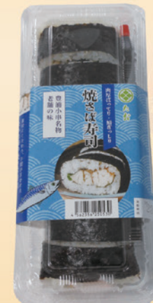
No.57 焼さば寿司 950円