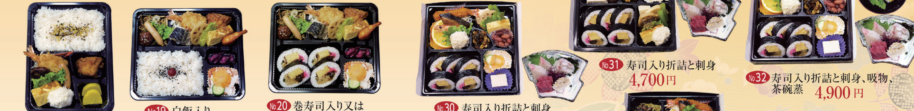
No18 白飯入り 650円 No19 白飯入り 950円 No20 巻寿司入り又はちらし寿司入り 1,000円 No21 白飯入り 1,800円 No22 巻寿司入り又はちらし寿司入り又はむすび入り子供用 2,000円 No23 巻寿司入り又はちらし寿司入り又はむすび入り子供用 2,500円 No30 寿司入り折詰と刺身 3,750円 No31 寿司入り折詰と刺身 4,700円 No32 寿司入り折詰と刺身、吸物、茶碗蒸 4,900円