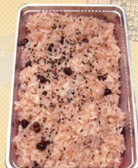
No.61 赤飯 (包装いたします) 写真は 1,100円 (5合) 2,500円 (1升) 4,900円