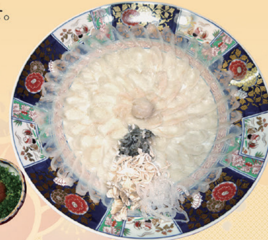
No.54 ふく刺盛 (39.5cm皿) 16,000円