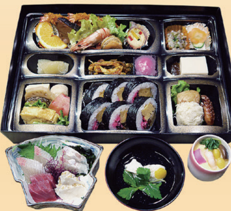
No.39 寿司入り折詰と刺身、吸物、茶碗蒸 8,000円