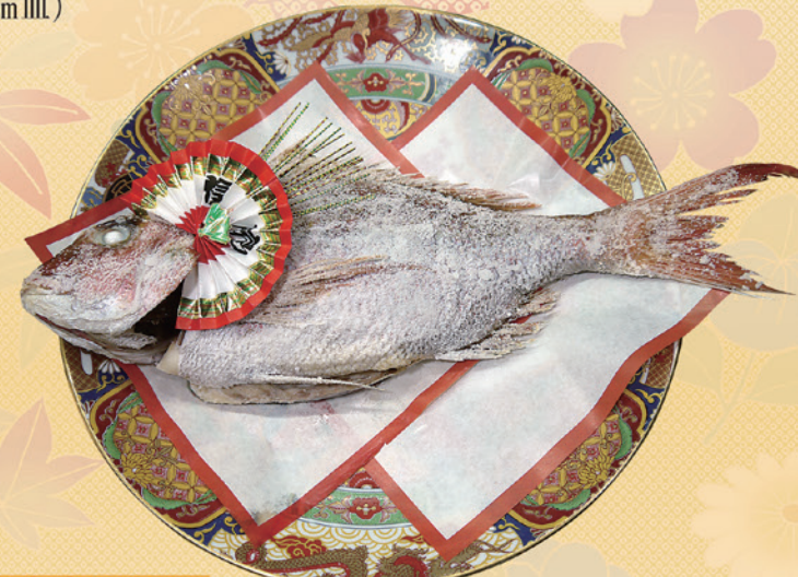
おすすめ商品! No.56 鯛塩焼 (1kg~2kg) 3,000円~6,000円