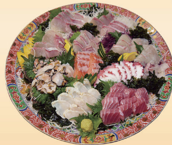
No.51 刺身盛 (46cm皿) 10,000円