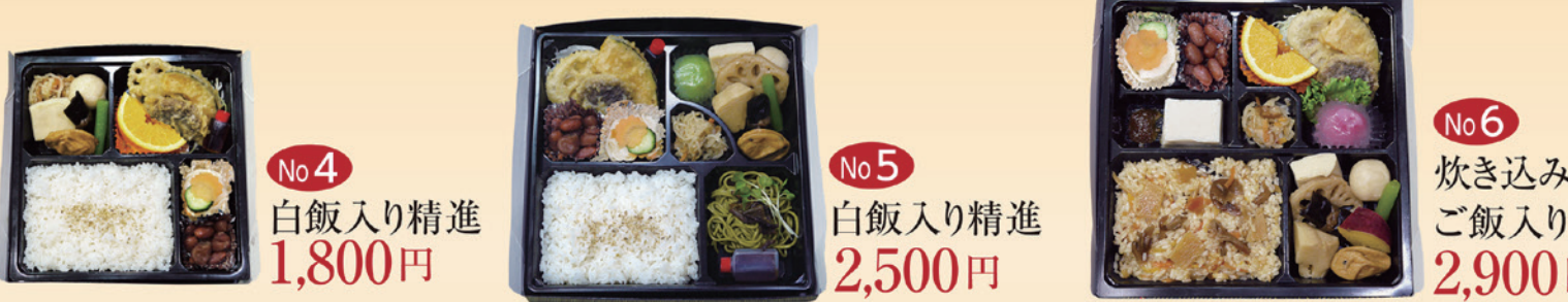
No4 白飯入り精進 1,800円 No5 白飯入り精進 2,500円 No6 炊き込みご飯入り精進 2,900円