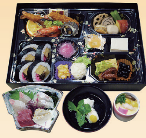
No.37 寿司入り折詰と刺身、吸物、茶碗蒸 7,200円