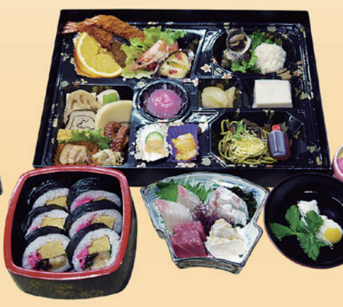
No.40 おかずのみ折詰と刺身、吸物、茶碗蒸、寿司 8,200円