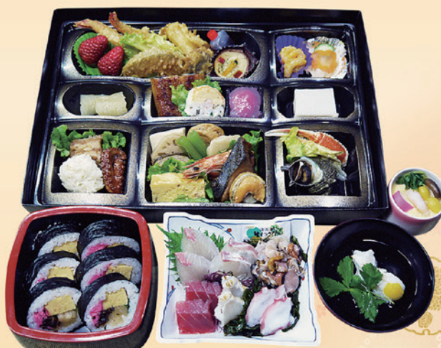
No.42 天ぷら入りおかずのみ折詰と上刺身、吸物、茶碗蒸、寿司 10,500円