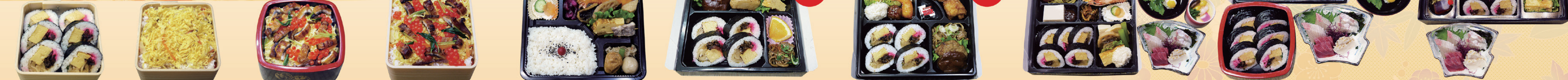
No7 巻き寿司 (4.5寸折) 750円 No8 ちらし寿司 (4.5寸折) 750円 No9 上ちらし寿司 (4.5寸折) 2,000円 No10 上ちらし寿司 (4.5寸折) (お持ち帰り用) 2,000円 No21 白飯入り 1,800円 No22 巻寿司入り又はちらし寿司入り又はむすび入り子供用 2,000円 No23 巻寿司入り又はちらし寿司入り又はむすび入り子供用 2,500円 No33 寿司入り折詰と刺身、吸物、茶碗蒸 5,800円 No34 おかずのみ折詰と刺身、吸物、茶碗蒸、寿司 6,200円 No35 寿司入り折詰と刺身 5,500円