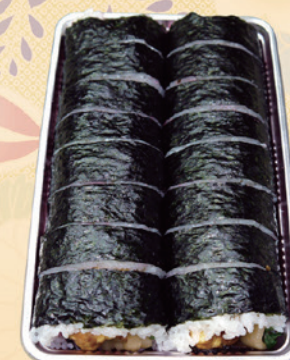
No.59 巻き寿司2本組 (包装いたします) 1,700円