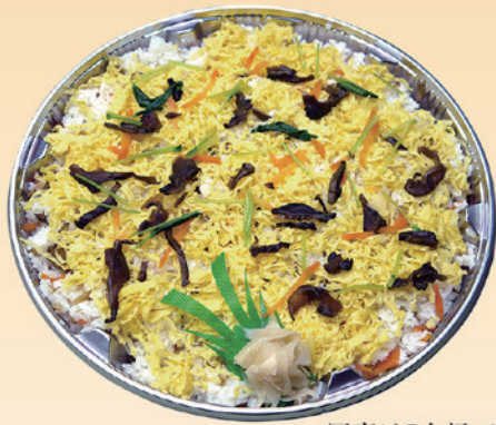
No.43 ちらし寿司 (5合桶) 2,000円 (1升桶) 3,900円