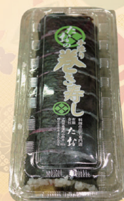
No.58 巻き寿司 850円