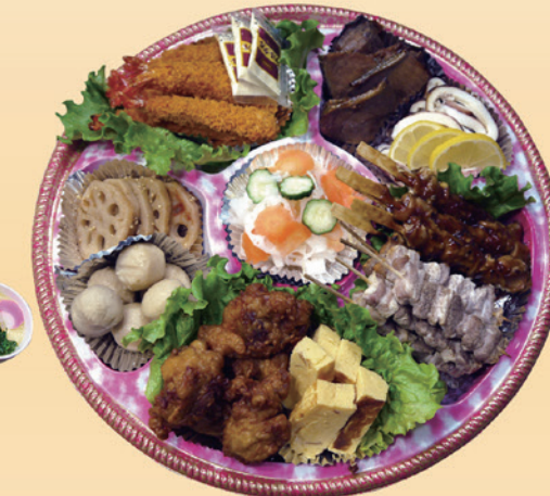
No.46 おかずのみ盛皿 (40cm皿) 6,500円