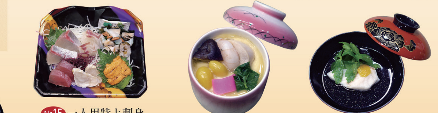
No15 一人用特上刺身 (お持ち帰り用) 2,500円 No16 茶碗蒸 700円 No17 鯛の吸物 420円