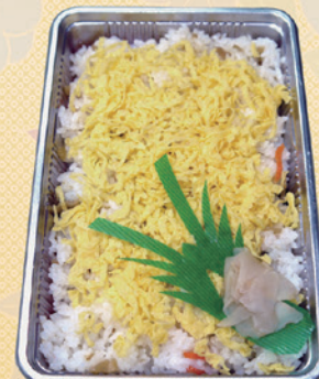
No.60 ちらし寿司 (包装いたします) 写真は 960円