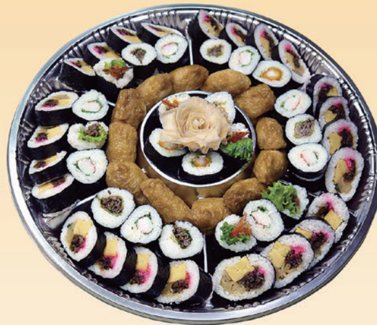
No.45 寿司盛 (49cm皿) 8,000円