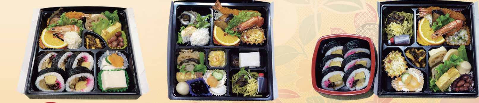
No27 寿司入り 2,900円 No28 おかずのみ 3,900円 No29 おかずのみ折詰と寿司 4,200円