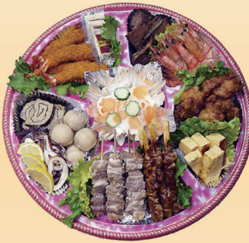
No.47 おかずのみ盛皿 (44cm皿) 10,000円