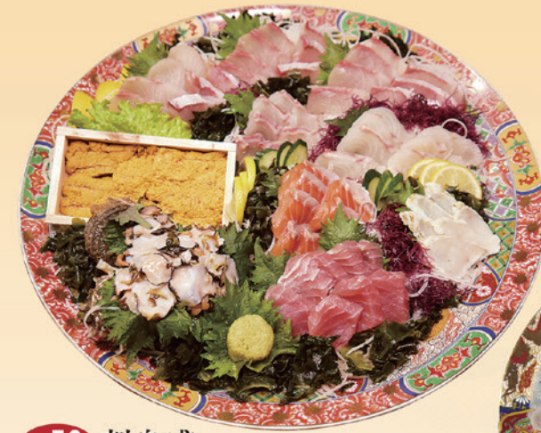
No.52 刺身盛 (46cm皿) 15,000円