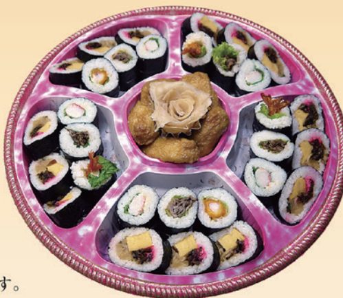
No.44 寿司盛 (44cm皿) 5,000円