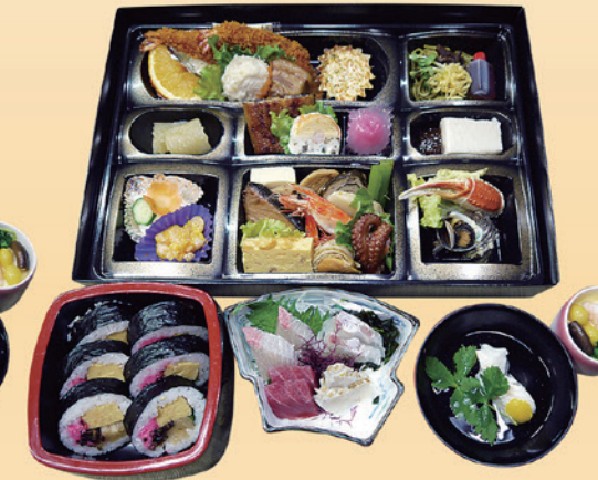
No.41 おかずのみ折詰と刺身、吸物、茶碗蒸、寿司 9,200円