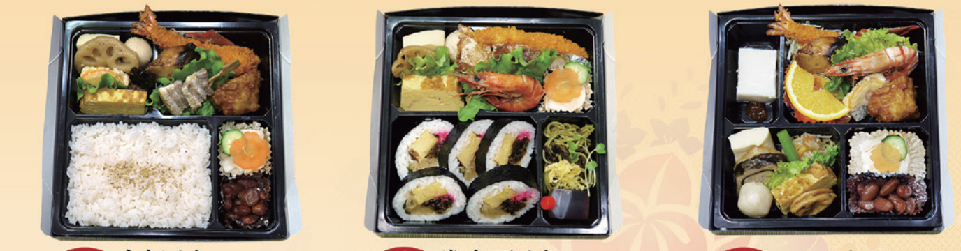
No24 白飯入り 2,000円 No25 巻寿司入り 2,300円 No26 おかずのみ 2,400円