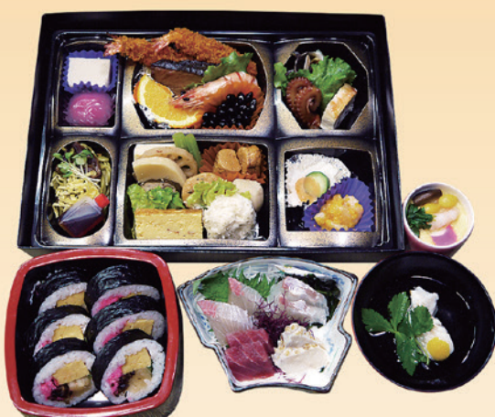
No.38 おかずのみ折詰と刺身、吸物、茶碗蒸、寿司 7,700円