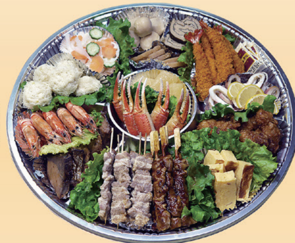
No.48 おかずのみ盛皿 (49cm皿) 13,000円