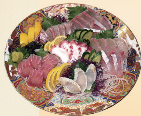
No.49 刺身盛 (33.5cm皿) 4,000円