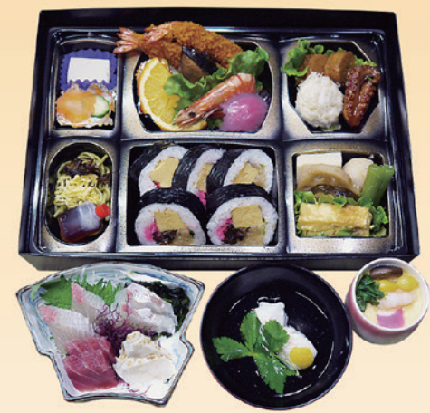
No.36 寿司入り折詰と刺身、吸物、茶碗蒸 6,600円

※刺身はすべて保冷箱に入れて配達いたします。 ※ふく刺のご注文は作業工程上2日前までにご注文くださいませ。