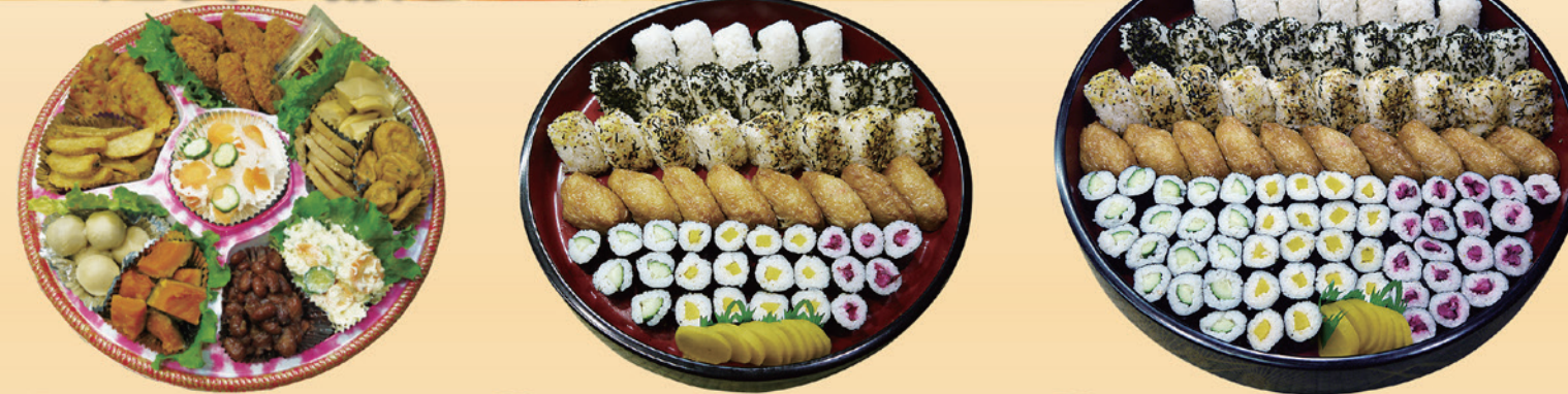
No1 おかずのみ精進盛皿 (39cm皿) 7,000円 No2 むすび、稲荷、細巻精進盛 (42cm桶) 5,500円 No3 むすび、稲荷、細巻精進盛 (47cm桶) 8,000円