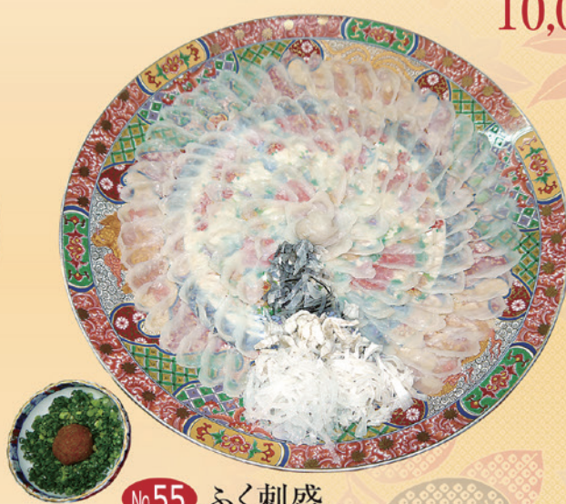
No.55 ふく刺盛 (46cm皿) 20,000円