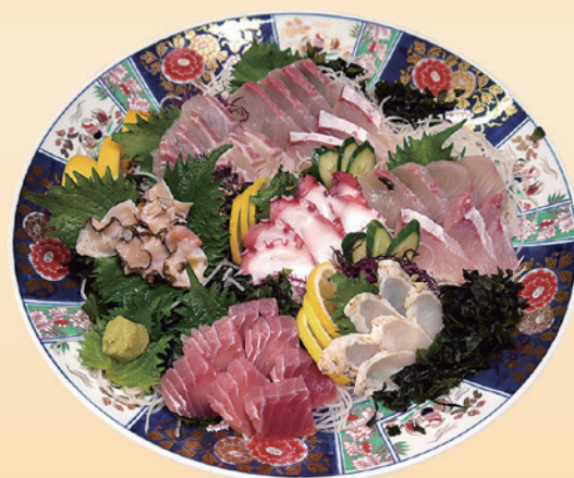
No.50 刺身盛 (39.5cm皿) 6,500円